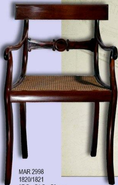
MAR 2998 1820/1821 87,5 x 54,5 x 53 cm Madeira de murta e palhinha Fundo Antigo do Palácio das Cortes